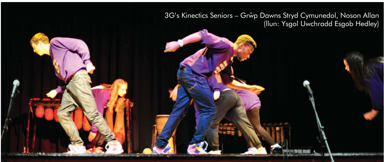
3G's Kinectics Seniors – Grŵp Dawns Stryd Cymunedol, Noson Allan