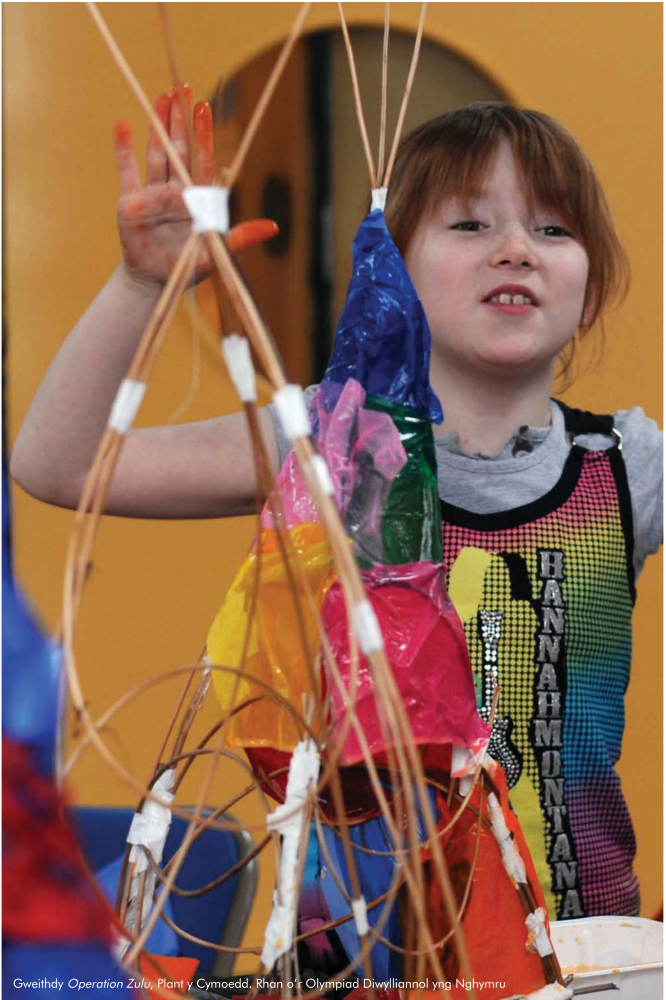
Gweithdy Operation Zulu , Plant y Cymoedd. Rhan o'r Olympiad Diwylliannol yng Nghymru