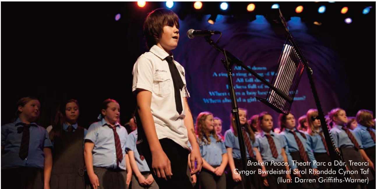
Broken Peace, Theatr Parc a Dâr, Treorci Cyngor Bwrdeistref Sirol Rhondda Cynon Taf