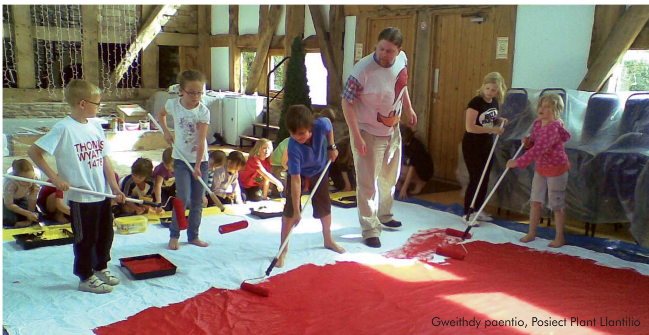
Gweithdy paentio, Posiect Plant Llantilio