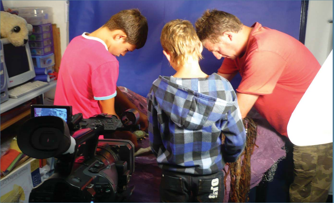
Cineig/Prosiect y Priordy, Cyrraedd y Nod