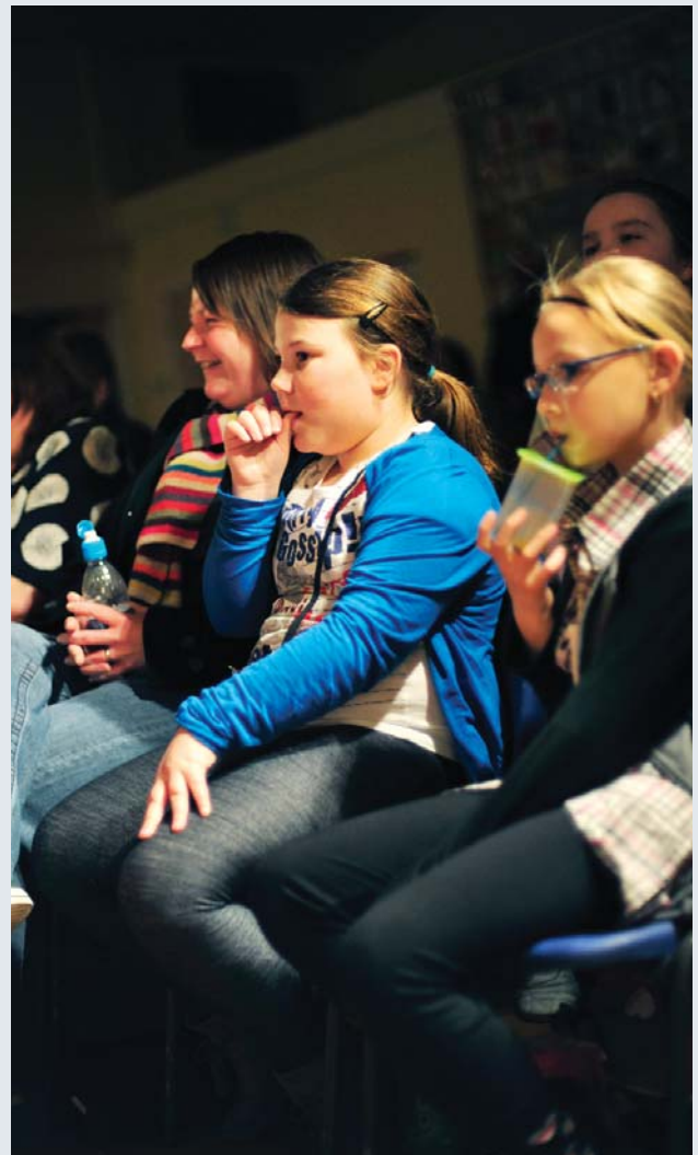
Cynllun Hyrwyddwyr Ifanc Noson Allan