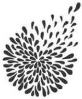
Taking Flight Theatre

Mae ein rhaglen camau creadigol yn cefnogi cyrff celfyddydau anabledd a BAME . Fe wnaethon ni helpu: