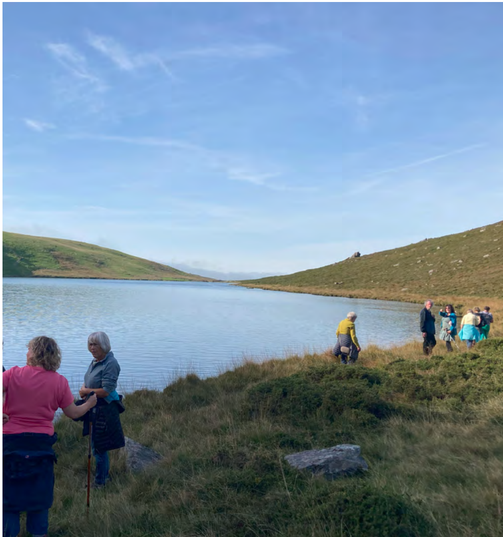
Llais y Lle, Taith gerdded Llyn Dulyn

Penodwyd Cydlynnydd Dysgu Cymraeg fel rhan o gytundeb â'r Ganolfan Dysgu Cymraeg. Nod y bartneriaeth yw creu gwasanaeth 'Iaith Gwaith' wedi ei deilwra'n arbennig ar gyfer y celfyddydau. Yn ystod y flwyddyn mae 175 o unigolion wedi derbyn y gwahanol gynigion i ddysgu Cymraeg. Mae'r cynigion hynny'n cynnwys gwersi wythnosol ar lein ar bob lefel, cefnogaeth i'r rhai sy'n dewis dilyn cwrs hunan astudio ar lein, cyrsiau preswyl yn Nant Gwrtheyrn, cynllun siarad ar draws y sector er mwyn cefnogi'r defnydd o'r Gymraeg a chyswllt cyson gyda'r sector trwy'r cydlynnydd.